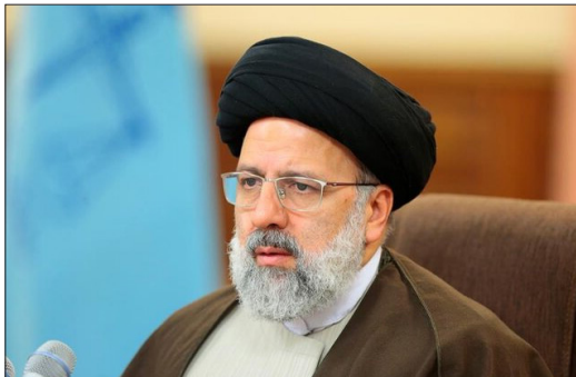
رئیس قوه قضائیه با اعلام اینکه مبارزه با فساد را در دستگاه قضایا باید تشدید کنیم گفت: اگر اعلام کردند سه نیروی فاسد از مجموعه کنار رفتند، این تضعیف دستگاه است یا تقویت آن؟ باور ما این است که این، تقویت دستگاه قضاست. باید معلوم شود در دستگاه سالم، دو لکه سیاه در نظر مردم جلب توجه کرده و این حرکت عظیم اثربخش تحت الشعاع ۴ نفر آدم

فساد قرار گرفته است. رئیس قوه قضائیه، فساد اقتصادی را ریشه بسیاری از فسادها از جمله فساد اخلاقی و سیاسی دانست و با تأکید بر اینکه برخورد با فساد و با کارکنان فاسد موجب تقویت دستگاه قضایی می‌شود، اظهار کرد: نباید اجازه دهیم دستگاه قضایی به ذره‌ای فساد آلوده شود، زیرا اعتماد عمومی و سرمایه اجتماعی را از دست می‌دهیم