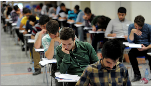
ابراهیم خدایی، رئیس سازمان سنجش آموزش کشور، خاطرنشان کرد: متأسفانه ما در عرصه گرایش به سمت رشته‌های علوم تجربی

و خالی ماندن ظرفیت رشته‌های علوم پایه با یک فاجعه در کشور مواجه هستیم. به این معنا که ما برای توسعه کشور باید در دو حوزه (رشته‌های علوم انسانی و ریاضی) که نقش اساسی در توسعه هر جامعه دارند، سرمایه گذاری کنیم. در واقع رشته‌های فنی و علوم انسانی از جمله این رشته‌هایی هستند که توسعه هر جامعه‌ای بر اساس آن اتفاق می‌افتد، اما در کشور ما وضعیت به گونه‌ای است