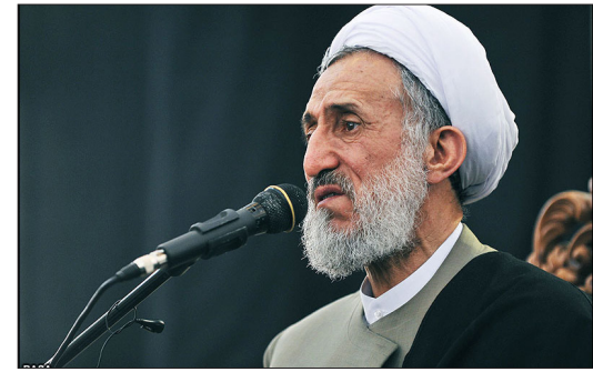
حجت الاسلام کاظم صدیقی در خطبه‌های نمازجمعه امروز (۱۷ آبان) تهران، لزوم توجه به یاد مستولان و حقوق بگیران ملت، این موضوع، مخصوصاً درباره خدا را مورد تأکید قرار داد و گفت:

اهمیت ویژه‌ای دارد. وی با بیان اینکه مستولان و مزدبگیران ملت، خود را ارباب بینند، تصریح کرد: این حقوق‌ها از سفره ملت و از جیب همین مردم است. از سفره همین مردم جنوب شهر و شهید داده‌ها و مدافعان بزرگوار حرم است. صدیقی ادامه داد: مستولان اگر خدا را یاد کنند، عائله خدا را از یاد نخواهند برد؛ گرانی و فاصله طبقاتی را تحمل نمی‌کنند؛ رنج رنجورها را برنمی‌تابند، برای رضای خدا، قسط و عدل و رعایت حقوق مردم را نصب‌العین خودشان قرار می‌دهند. همچنین نوکری مردم را برای خودشان افتخار می‌دانند. امام جمعه موقت تهران با تأکید بر لزوم عبرت گیری از برجام گفت: تأسف‌آورتر این است که هنوز هم عده‌ای پیگیر تصویب لوایح مرتبط با FATF هستند و گاهی هم دروغ می‌گویند. گفتند در جلسه سران قوا توافق شده و آن را به بیت رهبری مرتبط کردند که بعد هم تکذیب‌گری تا سه ماه را دارد. کافی نبود که آقایان می‌خوانند مضیقه‌های بیشتری را به ملت تحمیل کنند؟