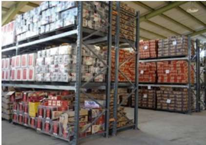
۳۲ میلیارد ریال برآورد کردند:وی. در این ارتباط یک احتکار کننده دستگیر و انبار کالا‌های احتکاری نیز مهروموم شد.

فرمانده انتظامی استان بوشهر گفت: یک انبار احتکار حاوی کالا‌های اساسی به ارزش ۳۲ میلیارد ریال در شهرستان دشتستان کشف شد.سردار حیدر سوسنی اعلام کرد: ماموران پلیس امنیت اقتصادی استان پس از انجام تحقیقات تکمیلی، کنترل نامحسوس و اطمینان از احتکار کالا در یک انبار در شهرستان دشتستان با هماهنگی مقام قضائی به همراه نمایندگان دستگاه‌های ذیربط به انبار موردنظر اعزام شدند. وی بیان کرد: در بازرسی از انبار ارزاق عمومی شامل ۲۰۰ کیلوگرم روغن، ۳۰۰ کیلوگرم چای، ۲۶ هزار بسته و کارتن مواد شوینده و بهداشتی، ۲۰۰ کارتن سبوا، ۶۰ هزار بطری انواع کنسرو و آمپوه، ۶۵ هزار بسته خشکبار و حبوبات و ۶۶۰ کیلوگرم تخمه کشف شد.سوسنی ادامه داد: کارشناسان ارزش کالا‌های احتکار شده