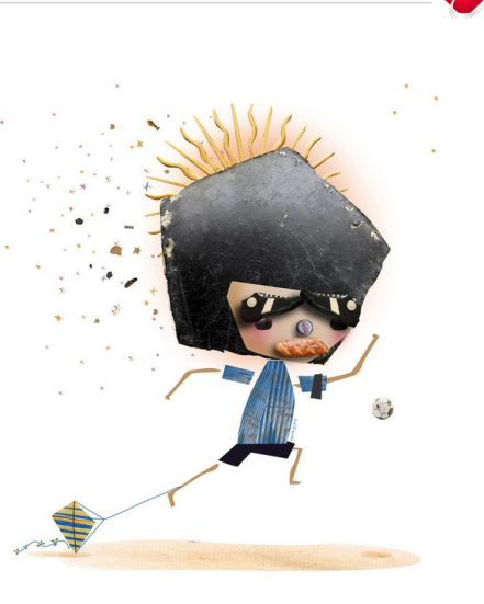
خوان فرانسسکو میر اندا