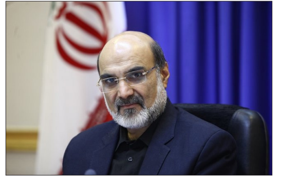
عبدالعلی علی عسکری رئیس دومین گرامیداشت طلابداران مقابله سازمان صداوسیما هم در مراسم با جنگ نرم با حضور و تجلیل از

شبکه‌های معاونت برون مرزی صداوسیما، به این دغدغه و نقد مهم پاسخ داد و گفت: در ایام محرم و در آستانه ایام ازبیینیم باید پیرو حضرت زینب(س) روایتگر این حرکت باشیم. وی افزود: همه روایتگران ما باید هنرمندانه روایت کنند سرعت، دقت و کیفیت باید هنرمندانه رعایت شود. ما باید در این جنگ رسانه‌ای بزرگ ابتدا ابعاد جنگ را درک و بعد بتوانیم به خوبی عمل کنیم. البته او در ادامه این مراسم به نکات دیگری هم اشاره و تأکید کرد: نکته قابل توجه،